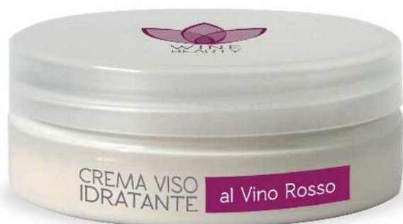
Linea Round - VASO 50 ml

“Avvolgente, lascia la pelle perfettamente idratata e vellutata”