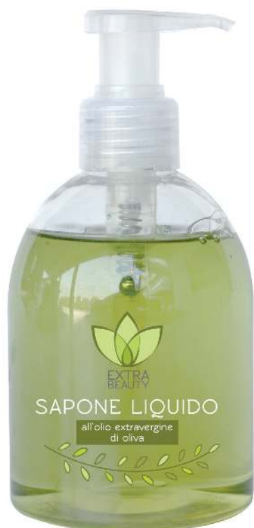
Linea Round - FLACONE 250 ml

“Delicatissimo, deterge donando emollienza e freschezza”